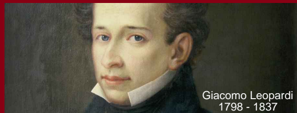
Giacomo Leopardi 1798 - 1837

A tutti coloro che amano conoscere e gustare i momenti e le opere più belle della nostra letteratura, abbiamo il piacere di rendere noto che con ottobre inizierà la quarta sessione della " Lectio storico-Letteraria " condotta dal